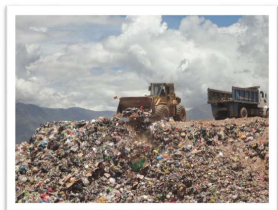
IMAGEN N° 02. PASIVO AMBIENTAL

Pasivo ambiental es un concepto que puede materializarse o no en un sitio geográfico contaminado por la liberación de materiales, residuos extraños o aleatorios, que no fueron