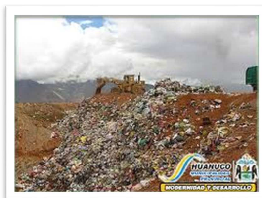
IMAGEN N° 04. BOTADERO DE CHILIPAMPA

Los problemas con infiltraciones que dirigen sus contaminantes a los canales de agua que utiliza la población