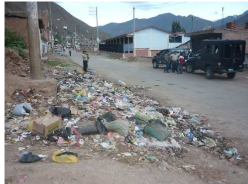
IMAGEN N° 06. CORDINACIONES CON LAS AUTORIDADES

locales de Huánuco como son los Municipios y Gobierno Regional.