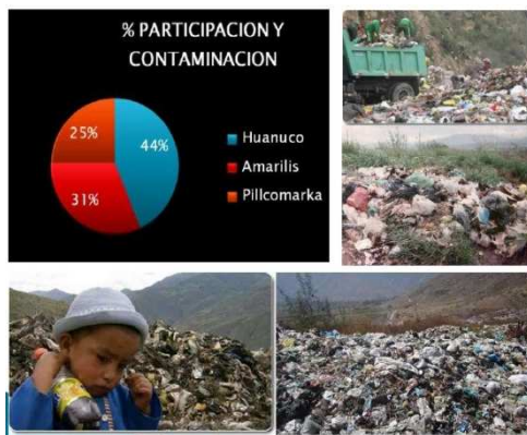
IMAGEN N° 01. PORCENTAJE DE CONTAMINACION DE LOS DISTRITOS DE HUÁNUCO, AMARILIS Y PILLCOMARCA