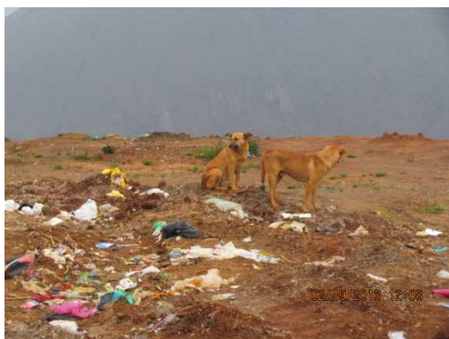
IMAGEN N° 05. BOTADERO DE CHILIPAMPA